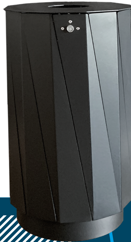
ZUM AUFSCHRAUBEN Modell: 7007-00