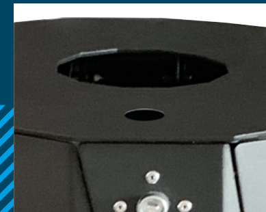
MIT ASCHER Modell: 7007-35 Modell: 7007-40

Alle weiteren Farben gegen Aufpreis, Farbton bei Bestellung bitte angeben.