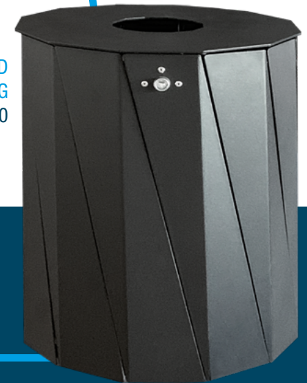
ZUR WAND- UND PFOSTENBEFESTIGUNG Modell: 7007-20